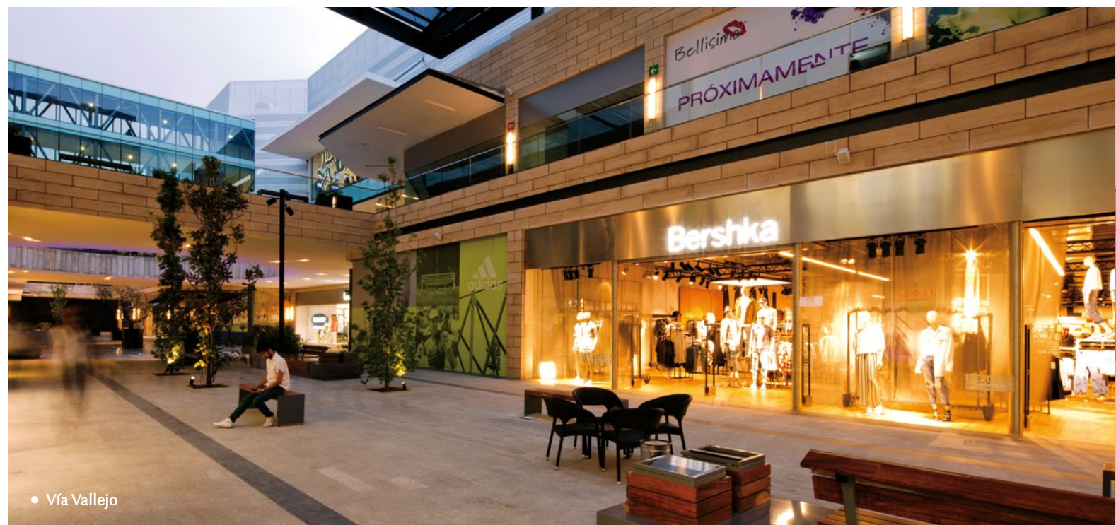
• Vía Vallejo

Grow Arquitectos agradece la participación de CREST y de todo el equipo de profesionistas que hicieron posible la realización de estos proyectos. •