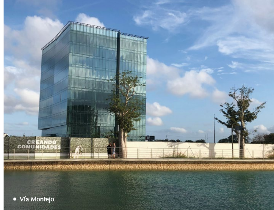
• Vía Montejo