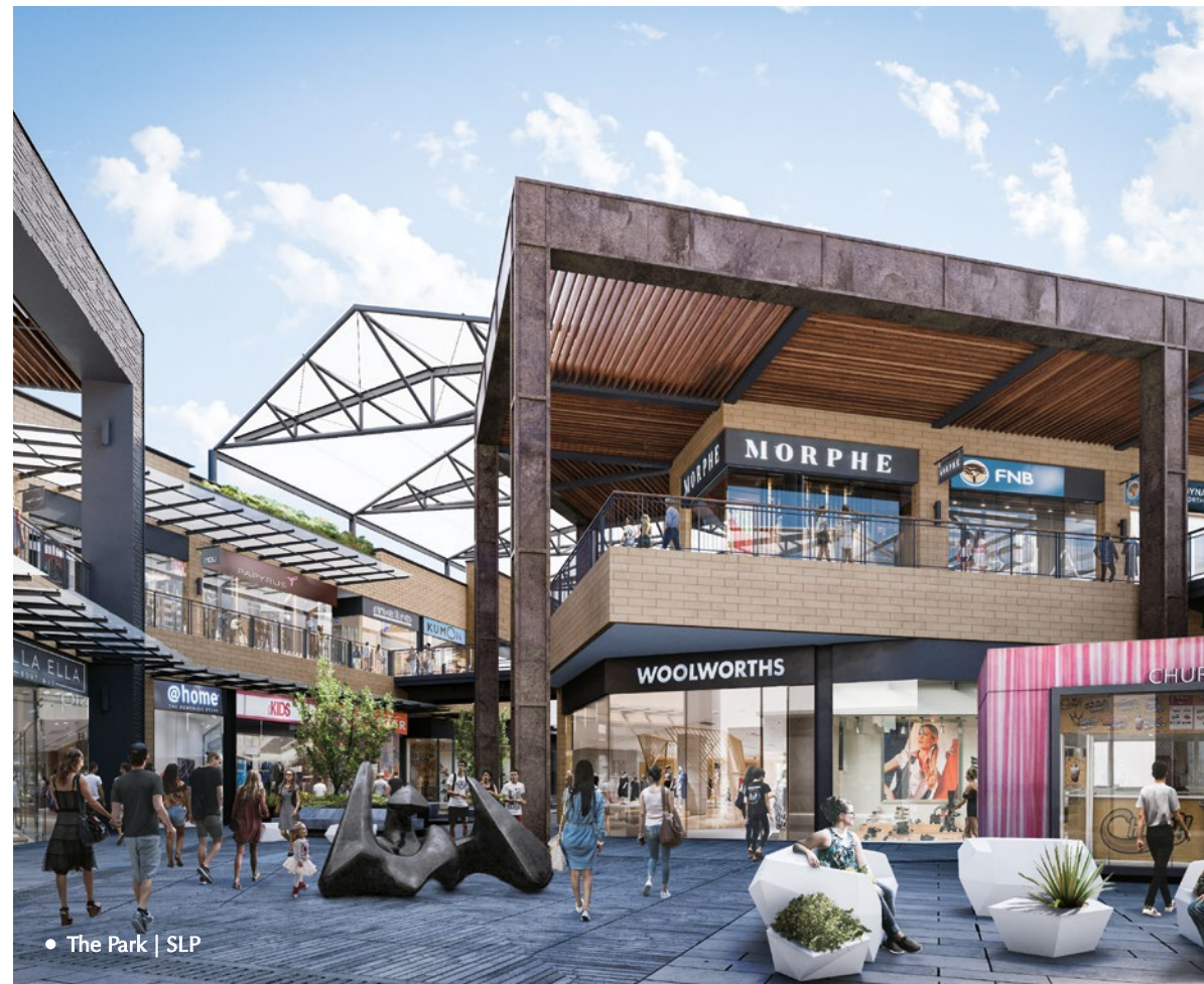
• The Park | SLP