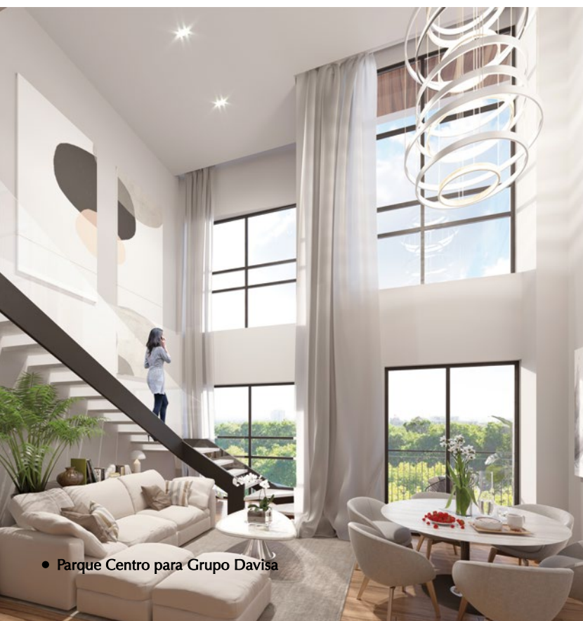
• Parque Centro para Grupo Davisa